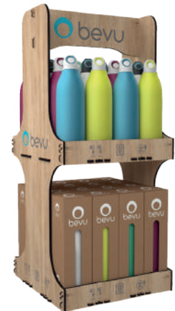
Expositores de mesa.