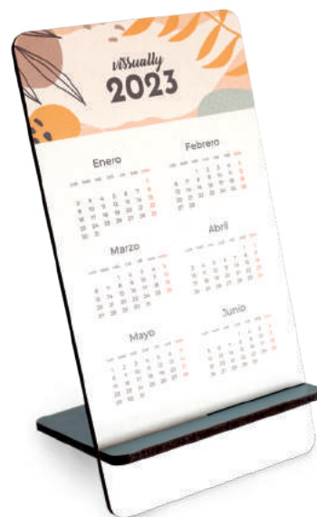
Calendário de mesa.