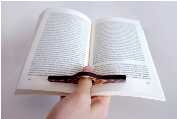
Abridor de página de leitura de uma mão.