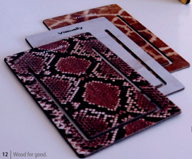
Marcadores de livros.