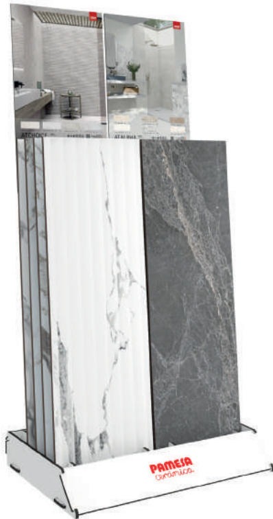
Expositores de cerâmica.