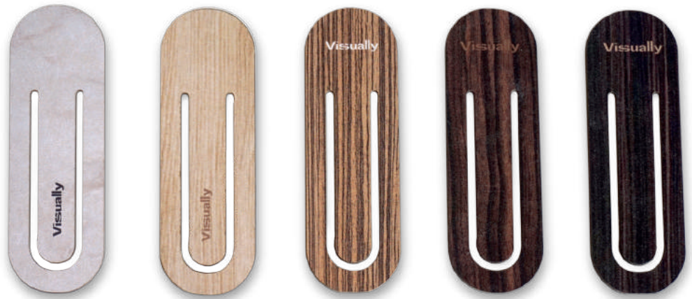
Marcadores de livros.

Moldamos sua ideia com infinitas possibilidades, transformando-a em um produto de qualidade e alto valor agregado.