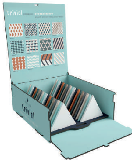
Caixas de amostra.