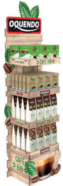
Expositores de productos.