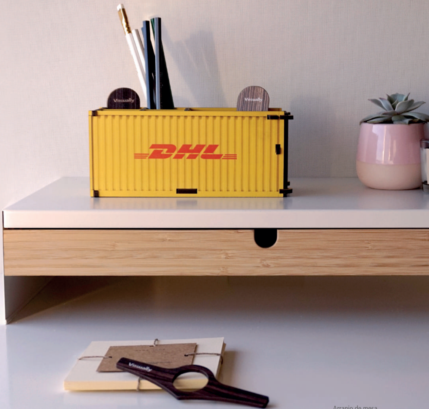
Arranjo de mesa.