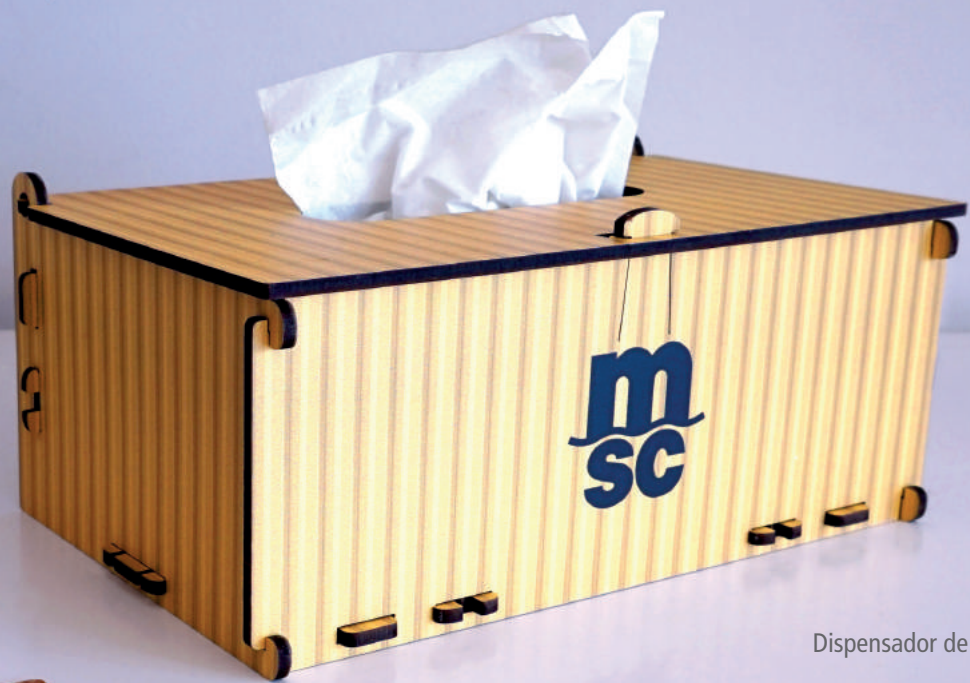
Dispensador de lenços.